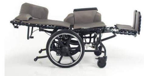
90° d'allongement du dossier