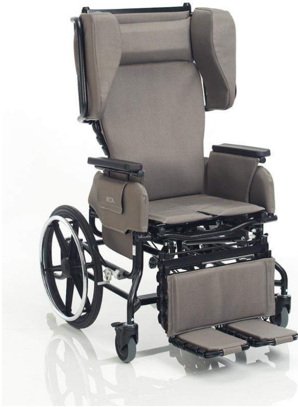
Fauteuil inclinable à allongement Elite 785 avec NOUVELLE option de structure noire et rembourrage gris météore

La solution idéale pour le confort en position assise et allongée