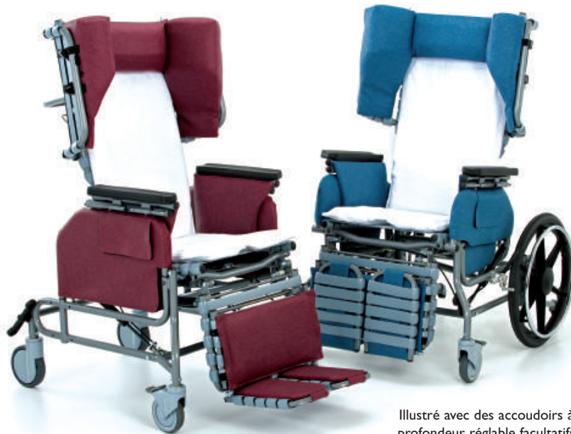
Illustré avec des accoudoirs à profondeur réglable facultatifs