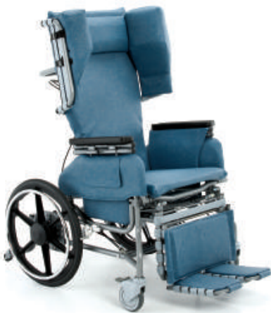
785 complètement recouvert de vinyle avec roues en alliage léger