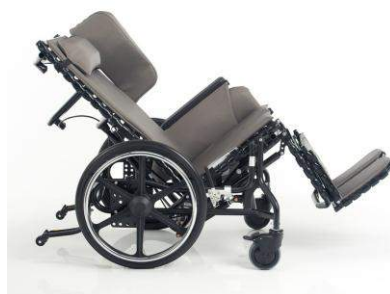
40° d'inclinaison du siège