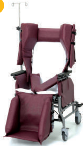
785 avec ensemble de coussins pour la paraplégie spastique (HSP) et poteau pour soluté