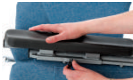
Accoudoirs à profondeur réglable Excellent pour les options de positionnement

Pour toutes autres dimensions sur mesure, communiquer avec le fabricant.