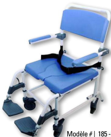
Modèle # | 185 - 20 po Large Modèle # | 186 - 22 po Ultra-Large