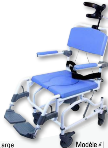
Modèle # | 190 - 18 po Inclenable Modèle # | 195 - 20 po Inclenable - Large

ROUES DE 24 PO DISPONIBLES EN OPTION POUR TOUS LES MODÈLES