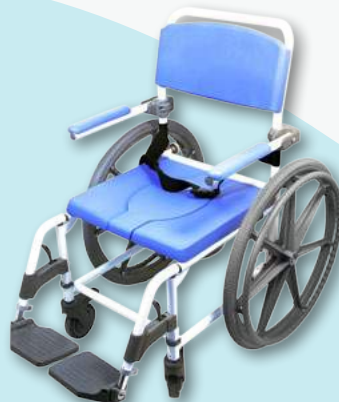
Modèle # | 180-24 po Modèle # | 185-24 po Modèle # | 186-24 po