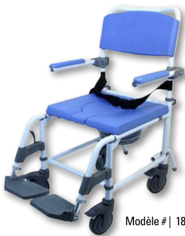
Modèle # | 180 - 18 po