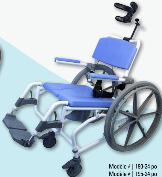
Modèle # | 190-24 po Modèle # | 195-24 po