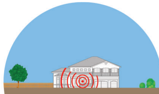
Portée d'un système d'intervention en cas d'urgence bidirectionnel dont le haut-parleur est situé dans le bloc de base. as Speakerphone is in the Base Station