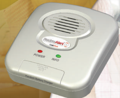
Bloc de base